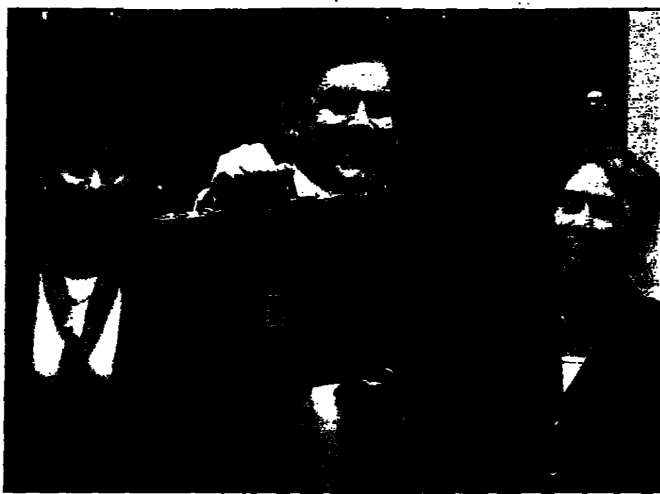
وزير المالية البريطاني خرون بران يشرح خطته المالية الجديدة

ضرائب اقل على الشركات لتشجيعها على الاستثمار